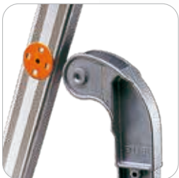
Articulation en fonte d'aluminium avec insert en polyamide pour éviter l'usure