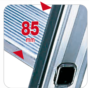
Marches en aluminium de 85 mm de profondeur, striées antidérapantes

MISE A JOUR AVEC LA NOUVELLE NORME: 01/2018