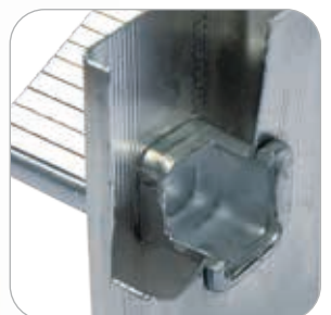
Liaison montant / marche par triple expansion et sertissage carré anti-rotation

Charge: 1.500 N / 1 minute Essai dynamique 50.000 cycles MARCHEPIEDS PROFESSIONNELS